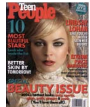
Teen People Noviembre 2006