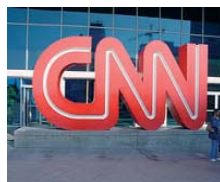
CNN American Morning