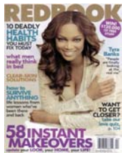
Redbook Magazine Abril 2006