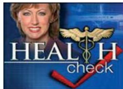
Health Check CBS13 News