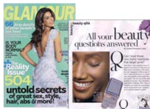
Glamour Abril 2006