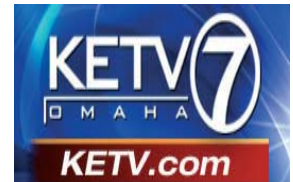
KETV 7 Omaha